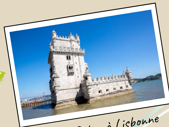
Tour de Belem à Lisbonne

La CALDEIRADA de PEIXE est une BOUILLABESSE à la Portugaise.