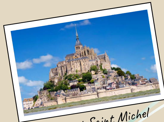
Le Mont Saint Michel

Le terme BLANQUETTE , vient de la sauce blanche à la crème et au BEURRE.